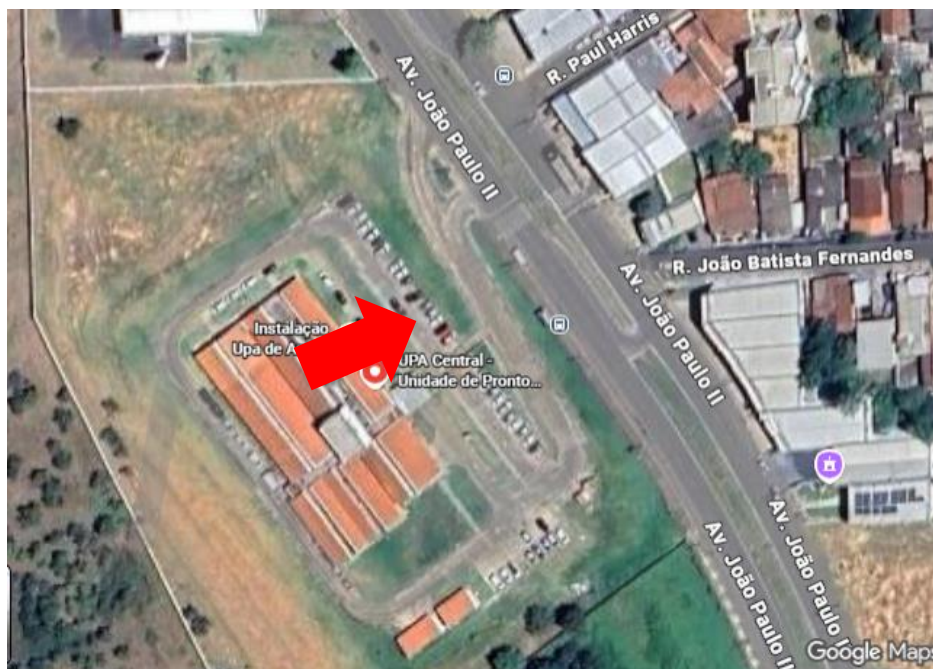
Imagem de Satélite – Localização da UPA Central 24h– Araxá- MG